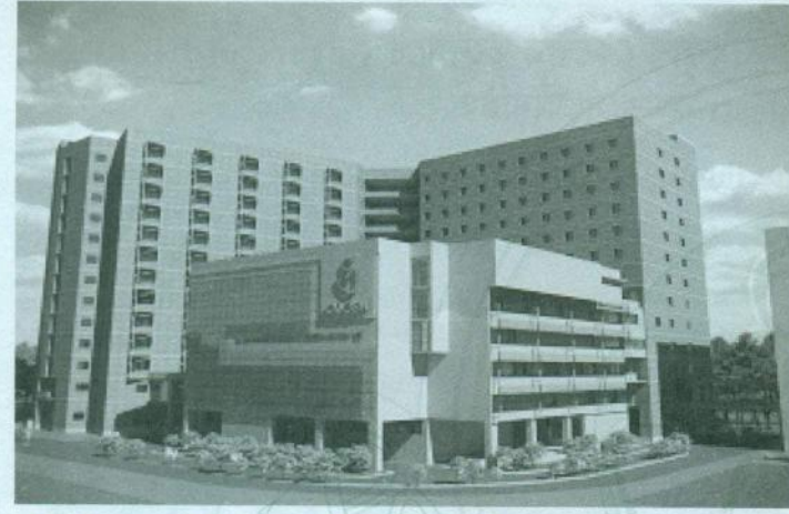
প্রস্তাবিত চট্টগ্রাম মা ও শিশু হাসপাতাল ভবন