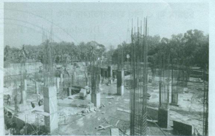
নির্মাণাধীন নতুন হাসপাতাল ভবন

অসহায়, দুঃস্থ ও গরীব রোগীদের এখানে সম্পূর্ণ বিনামূল্যে চিকিৎসা সেবা প্রদান করা হচ্ছে। এছাড়া অসহায় ও গরীব রোগীদের প্রয়োজ্য ক্ষেত্রে যাকাত ফান্ড ও দরিদ্র কল্যাণ তহবিল থেকে বিনামূল্যে প্রয়োজনীয় ঔষধ পত্র সরবরাহ করা হয়ে থাকে। অন্যান্য রোগীদের ক্ষেত্রেও অত্যন্ত কম মূল্যে বা নামমাত্র মূল্যে সকল চিকিৎসা সেবা প্রদানের ব্যবস্থা রয়েছে। অর্থাৎ কোনো রোগী অর্থাভাবে চিকিৎসা সেবা থেকে বঞ্চিত হবে না - এটি এই প্রতিষ্ঠানের একটি অন্যতম লক্ষ্য।